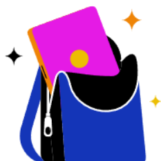
Mobile Office möglich