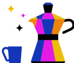
Kantine & Café-Bar