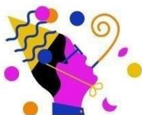
RTL Events & Partys