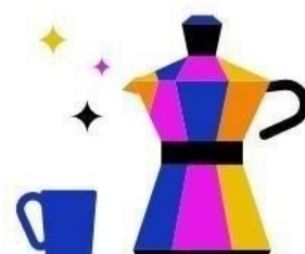
Kantine & Café- Bar