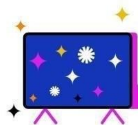
Kostenfreier Zugang zu RTL+